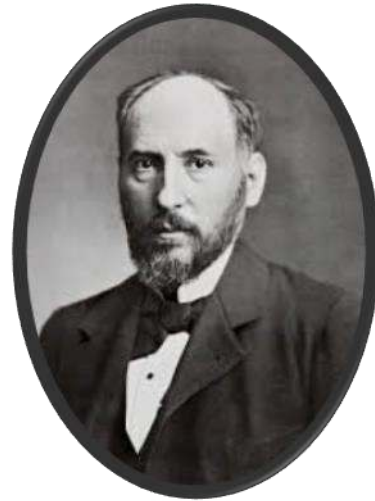
Santiago Ramón y Cajal (1852-1934)