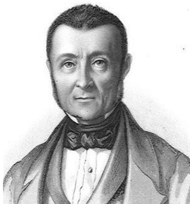
Du Potet (1796-1881)

El Baron Du Potet, (1796-1881), que añadió al mesmerismo matices esotéricos y fue miembro de la Sociedad Teosófica.