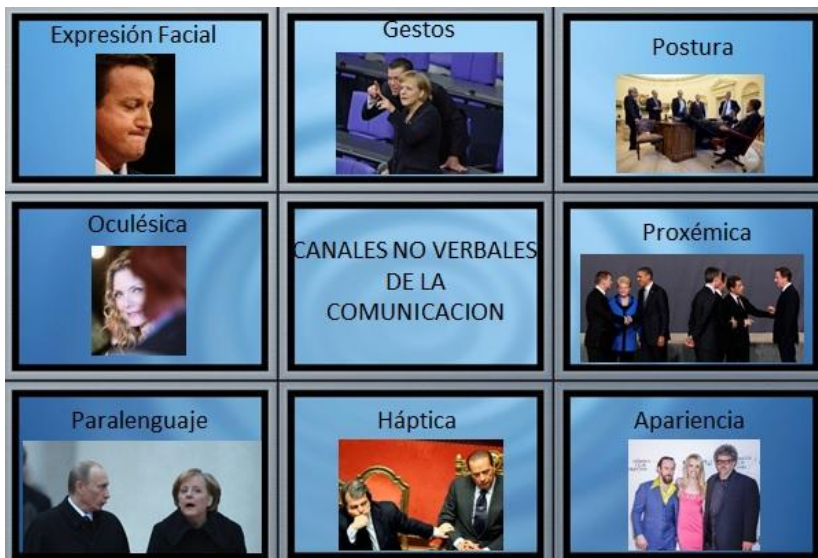
Figura 1: Canales Expresivos No Verbales

Además del Canal Expresivo Verbal, la comunicación se compone de los Canales Expresivos No Verbales con el que el cuerpo se expresa de forma dual, tanto conscientemente como inconscientemente, y se dividen para su estudio en Expresión Facial, Gestos, Posturas, Oculésica, Proxémica, Paralenguaje, Háptica, Apariencia.