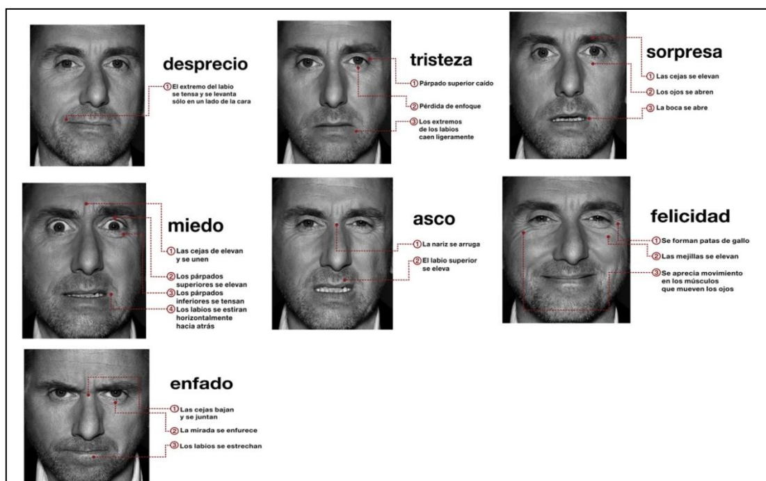
Figura 3: Emociones Básicas

Durante el estado hipnótico se suele sentir una sensación de calma, tranquilidad o relajación, que conlleva a una ralentización de la actividad motora. Las expresiones faciales, al igual que los movimientos corporales, se ven afectadas por ese estado de relajación, y se observa que aparecen con más lentitud y son más duraderas en el tiempo en comparación con el estado consciente del sujeto. De ahí que el clínico deberá de ser lo suficientemente hábil para detectar, analizar e interpretar las expresiones faciales, para poder orientar al sujeto hacia estados emocionales positivos. Sin embargo, no ocurre lo mismo con las Microexpresiones Faciales. Las microexpresiones son movimientos involuntarios y automáticos de los músculos de la cara que proceden directamente del inconsciente y cuya duración es extremadamente corta, siendo casi imposible que se pueda producir esos movimientos perfectamente de modo consciente o que se puedan falsear. Las microexpresiones son las expresiones de las emociones anteriormente descritas, pero su duración es de aproximadamente la vigésima parte de un segundo, y revelan el verdadero estado emocional de una persona, sea la situación en la que esté implicada, ya sea estando despierta o en estado hipnótico.